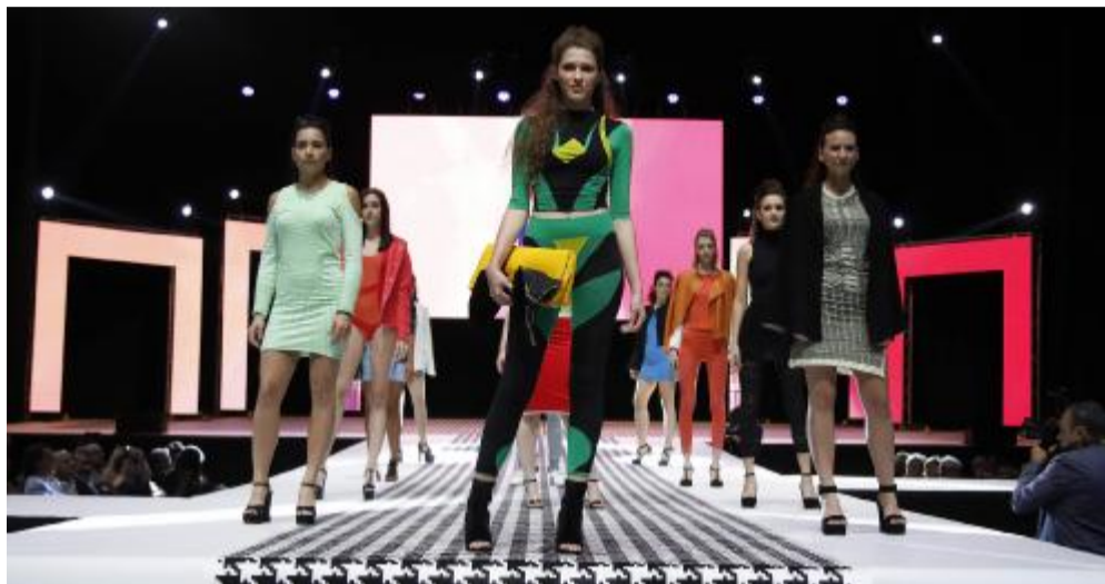
Il Palabrescia ha fatto da suggestiva coreografia alla sfilata di duecento abiti