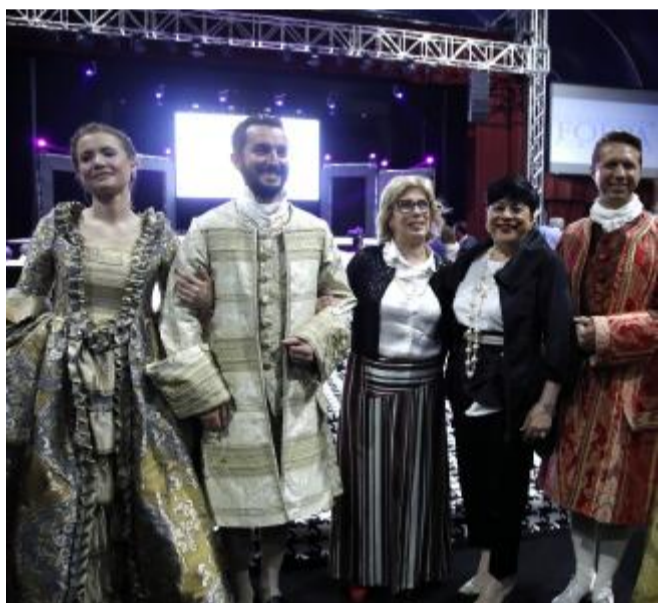
La «Serata della moda» ha strizzato l'occhio anche al passato